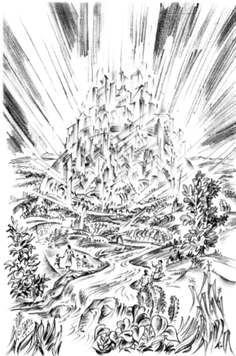
Het nieuwe Jeruzalem

des levens, helder als kristal, ontspringende uit de troon van God en van het Lam." Openbaring 22:1.