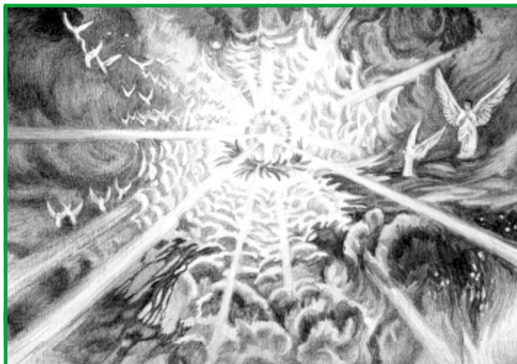
“Voici, il vient sur les nuées, et tout oeil le verra.” (Apocalypse 1 : 7)

Cher lecteur, nous croyons qu'il y a, de par le monde, des croyants fidèles