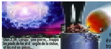
Dan.2,34: Lorsque une pierre...trappa les pieds de fer et d'argile de la statue, et les mit en pièces...

APRÈS CELA , le prophète Daniel voit - dans ces temps où les hommes essaient d'unifier les nations européennes et dans lesquels le monde est frappé par des guerres et des catastrophes - une grosse pierre venant frapper les pieds de la statue, et la détruisant entièrement. Cette pierre représente le retour du Christ (Daniel 2,34-35.44). Bientôt, Christ reviendra sur les nuées avec tous les anges, et tous le verront (Apoc. 1,7). Afin de préparer l'humanité à cet événement et afin de l'aider à passer le jugement, Dieu, dans son amour, avertit le monde au travers des trois derniers messages d'avertissement que nous trouvons dans Apocalypse 14,6-12.