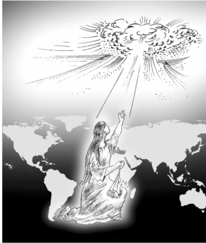
Die Brautgemeinde wartet auf ihren Bräutigam: Jesus

indem Sie lernen sich eigenständig mit ihm und der Bibel auseinanderzusetzen! Dann können Sie Gott verstehen, kennenlernen, den Kontakt zu ihm herstellen. Dann werden Sie Ihn lieben, für Ihn leben und sich in der größten Krise, die die Welt jemals erlebt hat, auf die richtige Seite schlagen.