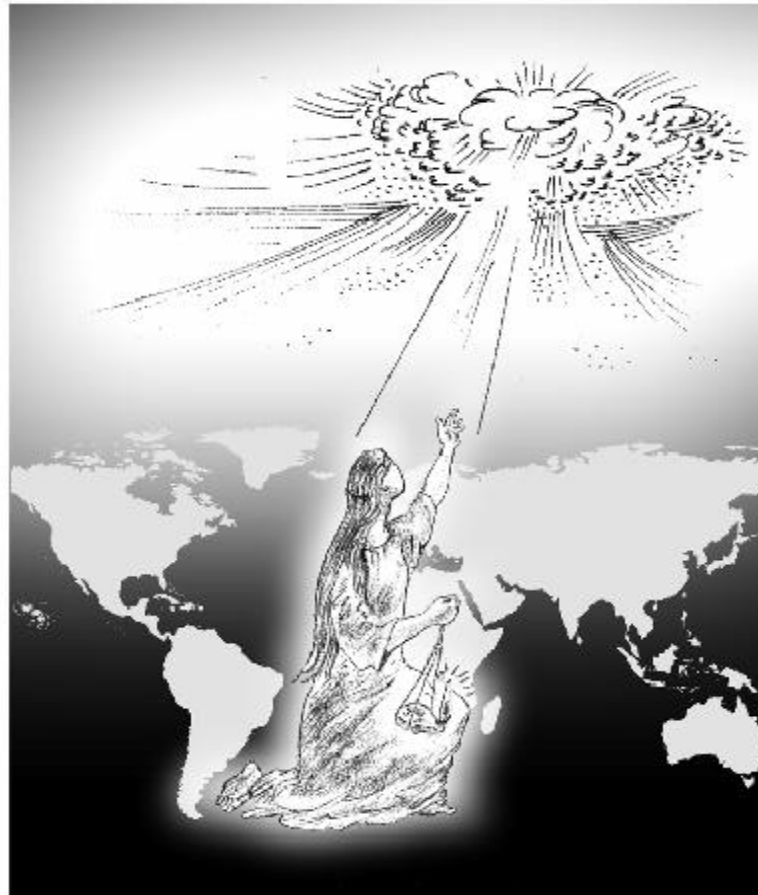
La sposa-chiesa aspetta il suo sposo: Gesù

In se stessa, la Bibbia contiene prove della sua origine divina. Nessun altro libro, come la Bibbia, può rispondere agli interrogativi della mente ed allo stesso tempo soddisfare i desideri del cuore. E' valida per gli uomini di ogni età e ceto sociale; è colma di sapienza