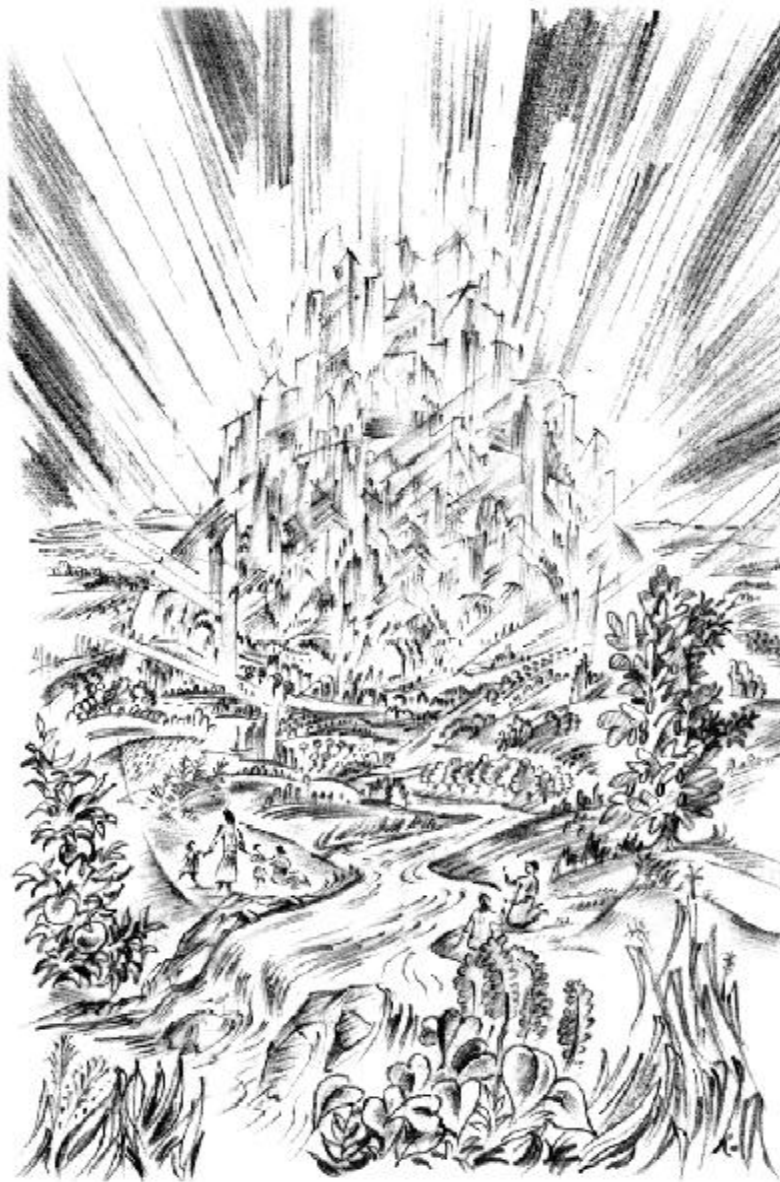
La nuova Gerusalemme

“Il gran conflitto è finito. Il peccato e i peccatori non esistono più. L'intero universo è purificato. Tutto il creato palpita di armonia e di gioia da colui che ha creato tutte le cose fluiscono la vita, la luce e la gioia che inondano lo spazio infinito. Dall'atomo più impercettibile al più grande dei mondi, tutte le cose, quelle animate e quelle inanimate, nella loro bellezza a perfezione, dichiarano con gioia che Dio è amore” Ellen G. White, Il gran conflitto, pag. 530