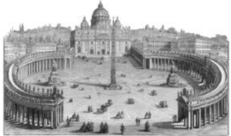
CHURCH OF ST. PETER, ROME

U MA das principais doutrinas do romanismo é que o papa é