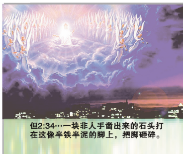
但2:34…一块非人手凿出来的石头打在这像半铁半泥的脚上，把脚砸碎。

先知但以理看到当人们正设法联合欧洲的国家并且世界上灾难和战争日益增多的时候，一块巨石将打在像的脚上并完全摧毁它。这石头代表耶稣基督的来临(但2:34-35，44，诗18:31)。基督将很快同祂的天使们在天云中再来，是全人类所看得见的(启1:7)。为了预备人类面临这一事件，并帮助他们在审判中站立，上帝用祂慈怜的爱，正在发出最后恩典的信息警告人类，这信息在启示录14:6-12中可以发现。