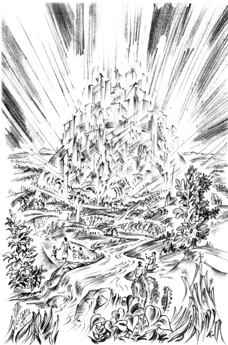
Het nieuwe Jeruzalem

"De grote strijd is ten einde. De zonde en de zondaren zijn er niet meer. Het gehele heelal is gereinigd. Overal in de schepping is eendracht en blijdschap. Van Hem Die alles geschapen heeft, komen stromen van leven, licht en vreugde, die alle delen van de oneindige ruimte bereiken. Van de kleinste atomen tot de grootste werelden, alle levende wezens en alle levenloze voorwerpen verkondigen in hun on-eindige schoonheid en volmaakte vreugde: God is liefde! " Het grote Conflict, pagina 740.