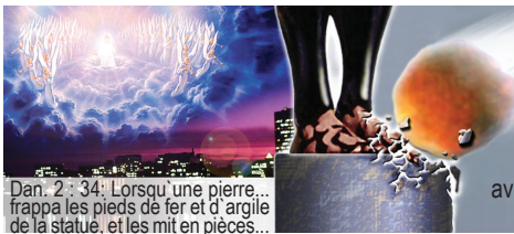
Dan. 2 : 34: Lorsqu'une pierre... frappa les pieds de fer et d'argile de la statue, et les mit en pièces...

APRÈS CELA, le prophète Daniel voit - dans ces temps où les hommes essayent d'unifier les nations européennes et dans lesquels le monde est frappé par des guerres et des catastrophes - une grosse pierre venant frapper les pieds de la statue, et la détruisant entièrement. Cette pierre représente le retour du Christ (Daniel 2 : 34-35.44). Bientôt, Christ reviendra sur les nuées avec tous les anges, et tous le verront (Apoc. 1 : 7). Afin de préparer l'humanité à cet événement et afin de l'aider à passer le jugement, Dieu, dans son amour, avertit le monde au travers des trois derniers messages d'avertissement que nous trouvons dans Apocalypse 14 : 6-12.