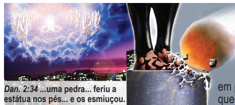
Dan. 2:34 ...uma pedra... feriu a estátua nos pés... e os esmiuçou.

O profeta Daniel viu que no tempo em que o homem procurasse unir as nações da Europa e do mundo, seria visitado cada vez mais por catástrofes e guerras; uma grande pedra chocará de encontro aos pés da estátua e a destruirá por completo. Essa pedra representa a 2ª Vinda de Jesus Cristo (Dan. 2:34-35, 44; Salmos 18:31). Cristo em breve virá sobre as nuvens do céu com os Seus anjos, visível para toda a humanidade (Ap. 1:7). A fim de preparar a espécie humana para este evento e ajudá-la a estar em pé durante o juízo, Deus, em Seu grande amor, adverte a humanidade com a última mensagem de misericórdia que se encontra em Apocalipse 14:6-12 .