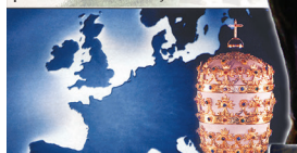
Dan 7:24 Cele 10 coarne, înseamnă că din împărăția aceasta se vor ridica 10 împărați.

În anul 168 î.Hr. romanii au fondat al 4-lea imperiu mondial pe pământ. Datorită durității și intoleranței față de celelalte popoare pe care le-au dominat, acest imperiu a fost considerat în istorie ca “Roma de fier” . (Vezi picioarele de fier a statuii și dinții de fiară.)