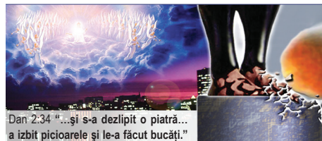
Dan 2:34 “...și s-a dezlipit o piatră... a izbit picioarele și le-a făcut bucați.”

În timp ce oamenii vor încerca să unească națiunile Europei și în lume catastrofele și războaiele se înmulțesc, profetul Daniel a văzut cum o piatră a lovit picioarele chipului și l-a distrus. Această piatră înseamnă revenirea lui Isus Hristos (Dan 2:35; Psalm 18:32). Hristos va reveni curând și va fi văzut de toți oamenii pe norii cerului (Apoc 1:7). Pentru a ajuta omenirea să se pregătească pentru aceste evenimente și pentru a putea sta la judecată, în iubirea lui, Dumnezeu avertizează oamenii prin ultima solie a harului care se găsește în Apocalipsa 14: