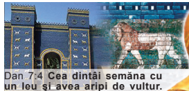
Dan 7:4 Cea dintâi semăna cu un leu și avea aripi de vultur.

Cu 2600 de ani în urmă a fost profetit prin profetul Daniel ridicarea și dezvoltarea marilor imperii mondiale și anume: Babilonia, Medo-Persia, Grecia și Roma , până la Europa zilelor noastre . Într-un vis profetul a văzut o statuie, iar părțile corpului ei simbolizând derularea exactă a acestor imperii mondiale: “...capul chipului acestuia era de aur curat; pieptul și brațele îi erau de argint; pântecul și coapsele îi erau de aramă; fluierul picioarelor, de fier; picioarele, parte de fier și parte de lut” ( Dan 2:32-33). Aceste mari imperii mondiale și deosebitele semne de identificare au fost arătate profetului, simbolic, ca animale de pradă. “Aceste patru fiare mari sunt patru împărați, care se vor ridica pe pământ” ( Dan 7:17). Iar ele ridicându-se ca “patru vânturi ale cerurilor au izbucnit pe marea cea mare” ( Dan 7:2). În Apoc 17:15 ne este arătat că “apa” = “noroadă, gloate, neamuri și limbi” . “Vânturile” sunt un simbol al războiului ( Ieremia 4:11-16). Cele patru vânturi ale cerului care bat pe marea cea mare reprezintă groaznicele cuceriri prin care aceste imperii și-au obținut puterea și teitoriul.