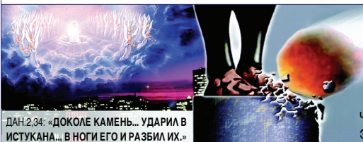
ДАН.2:34: «ДОКОЛЕ КАМЕНЬ... УДАРИЛ В ИСТУКАНА... В НОГИ ЕГО И РАЗБИЛ ИХ.»

В заключение пророк Даниил видит как в то время, когда люди пытаются объединить европейские нации, а на мир обрушиваются катастрофы и войны, огромный камень падает на ноги истукана и полностью разбивает его. Этот камень представляет собой пришествие Иисуса Христа (Да' 2:34-35.44). Христос скоро будет возвращаться в облаках небесных со Своими ангелами видимым образом для всех людей (Откр.1,7). Для того, чтобы подготовить человечество к этому событию и помочь людям выстоять на суде, Бог по Своей любви предостерегает этот мир тремя последними вестями предостережения, которые находим в 14 главе Открове'ия: