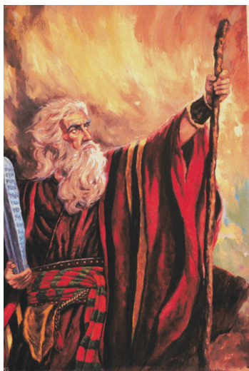
Comisión de los Diez Mandamientos.

Tal vez este sea el mayor engaño espiritual de la historia, ya que coloca la base en la mente de las personas, para continuar aceptando los CAMBIOS HUMANOS DE LA SANTA LEY DE DIOS, tal como lo ha propuesto la