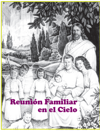
Reunión Familiar en el Cielo