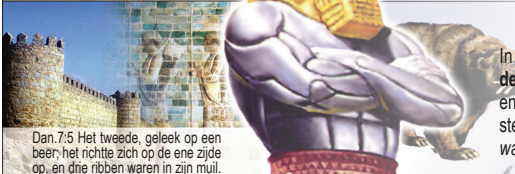
Dan. 7.5 Het tweede geleek op een beer, het richtte zich op de ene zijde op, en drie ribben waren in zijn muil.

In het jaar 538 v. Chr. werd het tweevoudige rijk van de Meden en de Perzen gevestigd. De drie ribben in zijn bek stellen Lydië, Babylon en Egypte voor, die door dit rijk zijn ingenomen. De Perzen waren sterker en regeerden langer dan de Meden ( Let wel: De ene zijde was hoger dan de andere ).