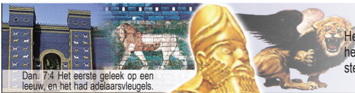
Dan. 7.4 Het eerste geleek op een leeuw, en het had adelaarsvleugels.

Het gouden hoofd en de leeuw (een bekend symbool in Babylon) stelt het wereldrijk Babylon voor (606-538 v. Chr.). De adelaarsvleugels stellen de snelle veroveringen voor door Nebukadnezar.