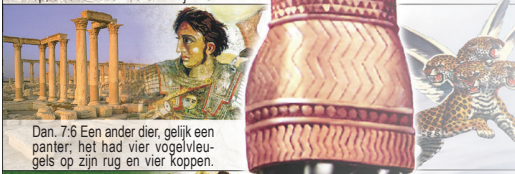
Dan. 7.6 Een ander dier, gelijk een panter; het had vier vogelvleugels op zijn rug en vier koppen.

De enorm snelle overwinningen (voorgesteld door de vier vleugels) onder Alexander de Grote maakten Griekenland tot wereldmacht (331 v. Chr.). Na de dood van Alexander werd het rijk in verdeeld door vier generaals: Tracië, Syrië, Macedonië en Egypte ( De vier koppen ).