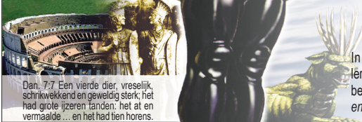
Dan. 7.7 Een vierde dier, vreselijk, schrikwekkend en geweldig sterk; het had grote ijzeren tanden; het at en vermaalde ... en het had tien horens.

In 168 v.Chr. vestigde zich het Romeinse Rijk . Vanwege zijn intolerantie en hardheid, waarmee het de volkeren regeerde staat het bekend als “Het ijzeren Rijk” ( Let op de ijzeren benen van het beeld en ijzeren tanden van het beest ).