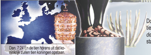
Dan. 7.24 En de tien horens uit dat koninkrijk zullen tien koningen opstaan.

Door de volksverhuizing (351-476 na Chr.) viel het Romeinse Rijk in tien kleinere Europese koninkrijken uiteen. ( Let op de tien horens en de tien tenen ). De afzonderlijke horens en de niet te vermengen bestanddelen van ijzer en leem stellen voor, dat Europa onverenigbaar is.