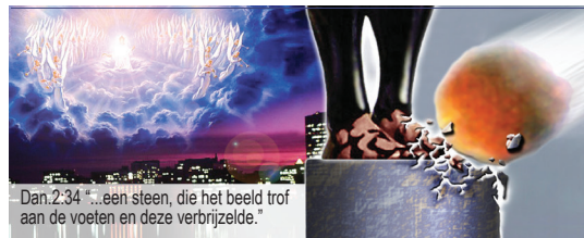
Dan. 2:34 "...een steen, die het beeld trof aan de voeten en deze verbrijzelde."

De profeet Daniel zag dat wanneer de mensen proberen de volken van Europa te verenigen en de wereld in toenemende mate geteisterd wordt door rampen en oorlogen, een grote steen het beeld aan zijn voeten zal treffen en het volledig zal vernietigen. Deze steen is een beeld van de wederkomst van Jezus Christus (Dan. 2:34,35; Psalm 18:32). Christus zal wederkomen op de wolken des hemels met al Zijn engelen, en iedereen zal dit zien (Openb. 1:7). Om de mensen op deze gebeurtenis voor te bereiden en hen te helpen te staan in het oordeel, waarschuwt God in Zijn liefde de mensheid door een laatste genadeboodschap die u vindt in Openb. 14:6-12.